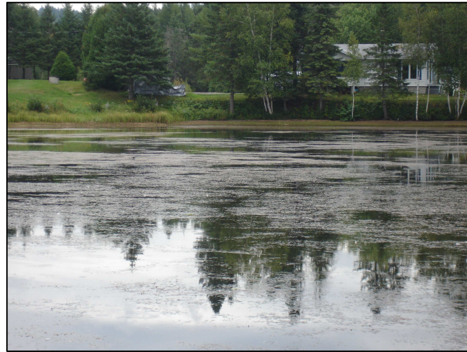
Colonie d' Élodée de Nuttall , photo prise au lac Saint-Alexis en 2011. Cette plante couvrait l'ensemble de la surface du lac, au point d'y gêner la circulation des embarcations.

Les Algues Chara et Nitella ont été regroupées en un seul groupe, car leur identification requiert un examen plus poussé en laboratoire. Même si elles ressemblent à des plantes aquatiques à première vue, elles sont de véritables algues. Elles sont donc dépourvues de véritables racines, tiges et feuilles. Ces algues ne forment pas de véritables fleurs et se reproduisent à partir de spores (RAPPEL, 2008). Nombreuses d'entre elles dégagent une odeur typique de mufette. On a retrouvé ces algues dans plus des trois quarts des secteurs inventoriés du lac Saint-Alexis. Notons que ces espèces sont souvent rencontrées dans les lacs mésotrophes et eutrophes (tableau 1).