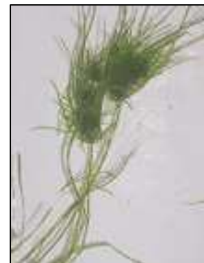
Nitella sp.

Les Algues Chara et Nitella ont été regroupées en un seul groupe, car leur identification requiert un examen plus poussé en laboratoire. Même si elles ressemblent à des plantes aquatiques à première vue, elles sont de véritables algues. Elles sont donc dépourvues de véritables racines, tiges et feuilles. Ces algues ne forment pas de véritables fleurs et se reproduisent à partir de spores (RAPPEL, 2008). Nombreuses d'entre elles dégagent une odeur typique de mufette. On a retrouvé ces algues dans plus des trois quarts des secteurs inventoriés du lac Saint-Alexis. Notons que ces espèces sont souvent rencontrées dans les lacs mésotrophes et eutrophes (tableau 1).