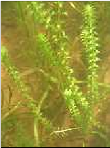
Élodée sp.

L'Élodée de Nuttall est une plante aquatique croissant en grandes colonies dans les eaux peu profondes (Marie-Victorin, 1995). On la distingue de l'Élodée du Canada (qui est plus généralement répandue) par ses feuilles plus pâles et plus pointues. Elle possède une grande capacité de reproduction végétative, elle peut se multiplier par drageonnement et par bouturage (Fleurbec, 1987), ce qui lui confère un potentiel d'envahissement élevé. De plus, les élodées ne seraient pas consommées par les oiseaux ni par les poissons. Utilisée comme plante d'aquarium, elle a été introduite en Europe depuis plus d'un siècle où elle est considérée comme une espèce invasive d'importance. Cette espèce typique des lacs eutrophes était présente sur l'ensemble de la superficie du lac Saint-Alexis en 2011.