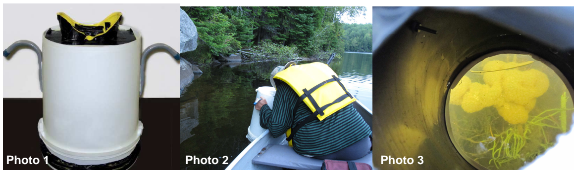
Photo 1 : Aquascope maison fabriqué à partir du protocole de Legendre, 2008.

Les secteurs de la zone littorale ont été déterminés et géoréférencés à l'aide d'un GPS directement sur le terrain. Par la suite, l'inventaire de la zone littorale a été effectué visuellement à l'aide d'un aquascope pour des profondeurs variant entre 0 et 2 mètres, et ce, pour chaque secteur du littoral. Pour ces différents secteurs, l'inventaire des macrophytes a été réalisé par l'estimation du recouvrement occupé par les différentes espèces (ou groupes taxonomiques † ) de macrophytes. L'identification des macrophytes a été effectuée sur le terrain et en laboratoire lorsqu'un microscope était requis. Parallèlement, la caractérisation des sédiments de fond de la zone littorale a été réalisée par l'évaluation visuelle du type de substrat (ex. : sédiments fins, sables, gravier, etc.) et par l'estimation de la profondeur des sédiments récents.