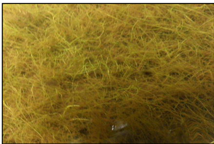
Éléocharide aciculaire photographiée à partir d'un aquascope. Lac Saint-Alexis, 2011.

Trois taxons présents au lac Saint-Alexis étaient dominants en raison de leur importance (leur occurrence et leur recouvrement élevé) : l' Élodée de Nuttall , l' Éléocharide acicularis et les Algues Chara et Nitella . Avant de présenter ces trois taxons notons que des neuf taxons dominants cités plus haut, cinq d'entre eux sont typiques des lacs mésotrophes ou eutrophes (tableau 1).