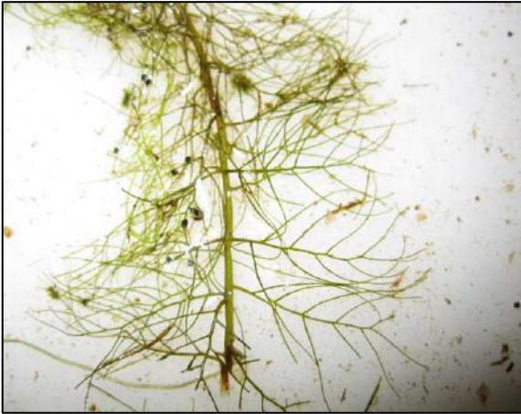
Myriophylle sp. Échantillon prélevé au lac à la Perchaude pour identification à l'aide d'un stéréoscope en laboratoire. Photo : Sophie Lemire, 2011.

Le Myriophylle sp que l'on retrouve au lac à la Perchaude n'a pu être identifié à l'espèce, car aucune fleur nécessaire à l'identification n'a été trouvée. Distinguer les espèces de myriophylles en l'absence de fleurs ou de fruits s'avère une tâche très difficile (Fleurbec, 1987), souvent une analyse de l'ADN est requise pour confirmer l'identification (Washington, 2001). Cependant, cette espèce n'est pas le Myriophylle à épis ( Myriophyllum spicatum L.), une espèce exotique envahissante, car des caractéristiques anatomiques nous ont permis d'écarter cette espèce.