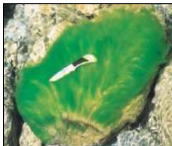
Algues vertes filamenteuses

La présence excessive des algues filamenteuses et du périphyton ‡ a aussi été notée pour chaque secteur inventorié. Ces deux types d'algues sont indicatrices d'eutrophisation lorsqu'elles sont surabondantes, soit assez abondantes pour être visibles à l'œil nu.