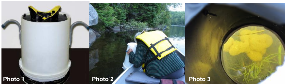
Photo 1 : Aquascope maison fabriqué à partir du protocole de Legendre, 2008.

Les secteurs de la zone littorale ont été déterminés et géoréférencés à l'aide d'un GPS directement sur le terrain. Par la suite, l'inventaire de la zone littorale a été effectué visuellement à l'aide d'un aquascope pour des profondeurs variant entre 0 et 2 mètres, et ce, pour chaque secteur du littoral. Pour ces différents secteurs, l'inventaire des macrophytes a été réalisé par l'estimation du recouvrement occupé par les différentes espèces (ou groupes taxonomiques † ) de macrophytes. L'identification des macrophytes a été effectuée sur le terrain et en laboratoire lorsqu'un microscope était requis. Parallèlement, la caractérisation des sédiments de fond de la zone littorale a été réalisée par l'évaluation visuelle du type de substrat (ex. : sédiments fins, sables, gravier, etc.) et par l'estimation de la profondeur des sédiments récents.