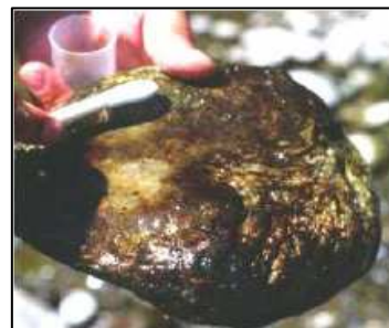
Algues brunes microscopiques Source : Campeau et coll. 2008