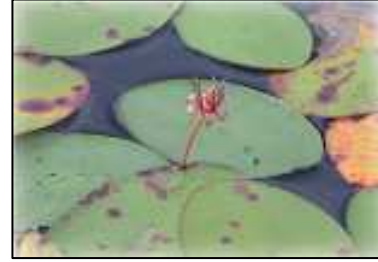
Brasénie de Schreber.

La Brasénie de Schreber est une plante aquatique flottante qui croît en colonies parfois envahissantes dans quelques lacs dispersés du Québec (Marie-Victorin, 1995). Elle se distingue des autres plantes aquatiques à feuillage flottant par ses feuilles entières elliptiques attachées en leur centre par une queue. Cette espèce se caractérise aussi par un épais mucilage gélatineux et gluant qui enveloppe ses parties submergées. Elle possède quelques petites fleurs beiges rosées (RAPPEL, 2008). La Brasénie de Schreber pousse à 1 ou 2 m de profondeur, tant dans des eaux tranquilles, abritées et pauvres (milieux oligotrophes), que dans les eaux plus riches (milieux eutrophes) (Fleurbec, 1987). Cette espèce était présente dans tous les secteurs littoraux inventoriés du lac à la Perchaude en 2011, où elle formait d'importantes colonies par endroits.