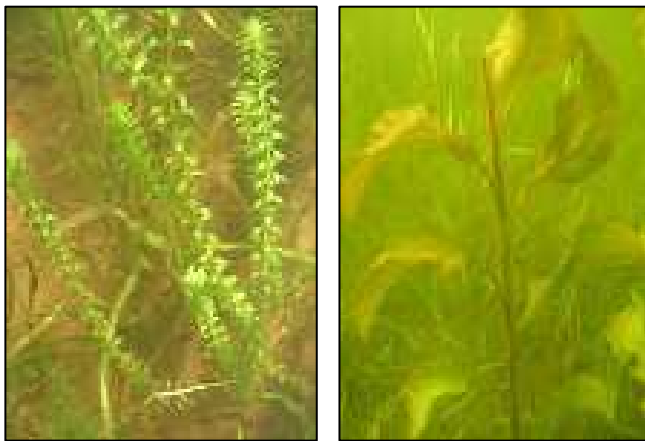
Élodée sp (photo de gauche) et Potamot à larges feuilles (photo de droite).

Deux espèces abondantes au lac à la Perchaude sont considérées comme envahissantes, bien qu'elles soient indigènes : le Potamot à larges feuilles et l' Élodée du Canada . Soulignons que la première a été observée dans 86 % des secteurs inventoriés et la seconde dans 64 % des secteurs. Ces deux espèces se multiplient abondamment par drageonnement et par bouturage de la tige (Fleurbec, 1987), leur conférant un avantage sur les autres espèces de plantes aquatiques. Des précautions devront être prises afin d'éviter sa propagation dans d'autres lacs de la région. Ces précautions doivent être prises lors des déplacements en embarcation munie d'un moteur, qu'il soit électrique ou non. L'hélice de ces moteurs pourrait déloger et propager cette espèce ailleurs dans la région.