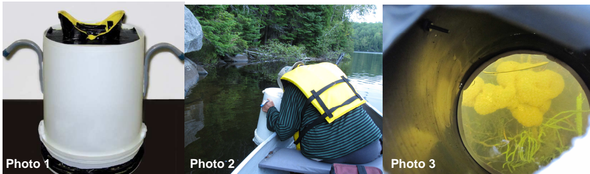
Photo 1 : Aquascope maison fabriqué à partir du protocole de Legendre, 2008.

Les secteurs de la zone littorale ont été déterminés et géoréférencés à l'aide d'un GPS directement sur le terrain. Par la suite, l'inventaire de la zone littorale a été effectué visuellement à l'aide d'un aquascope pour des profondeurs variant entre 0 et 2 mètres, et ce, pour chaque secteur du littoral. Pour ces différents secteurs, l'inventaire des macrophytes a été réalisé par l'estimation du recouvrement occupé par les différentes espèces (ou groupes taxonomiques † ) de macrophytes. L'identification des macrophytes a été effectuée sur le terrain et en laboratoire lorsqu'un microscope était requis. Parallèlement, la caractérisation des sédiments de fond de la zone littorale a été réalisée par l'évaluation visuelle du type de substrat (ex. : sédiments fins, sables, gravier, etc.) et par l'estimation de la profondeur des sédiments récents.