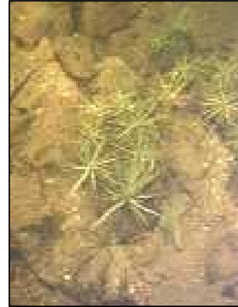
Ériocaulon à sept angles

L'Ériocaulon à sept angles est une plante aquatique commune au Québec. Cette espèce se caractérise par ses feuilles longuement triangulaires disposées en rosette à la surface du sol (RAPPEL, 2008). Elle colonise les eaux peu profondes (moins de 1 mètre) qui reposent généralement sur un substrat graveleux ou sableux. Typique des milieux oligotrophes, on la retrouve aussi dans les plans d'eau mésotrophes (Fleurbec, 1987). Compte tenu de sa petite taille, cette espèce ne limite que très peu les activités humaines. On la retrouvait dans l'ensemble des secteurs inventoriés (88 % des secteurs), et lorsqu'elle était présente, elle occupait 11 % de la zone littorale.