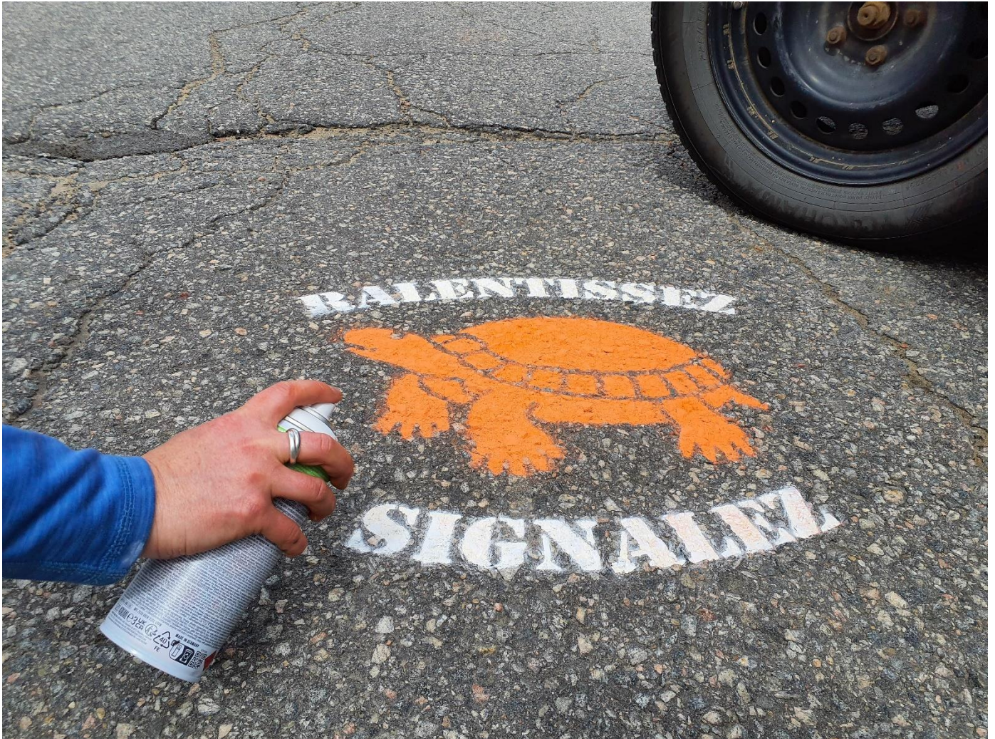
OBVRLY, Saint-Alexis-des-Monts, 21 mai 2025